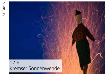
12.6. Kremser Sonnenwende