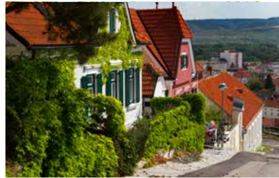
Drei Workshops brachten konkrete Verbesserungsvorschläge, z.B. zur Schaffung neuer Grünoasen und öffentlicher Treffpunkte oder auch zur Entschärfung der Langenloiser Straße für Radfahrende. Ziel ist ein Mobilitätskonzept für den Stadtteil.