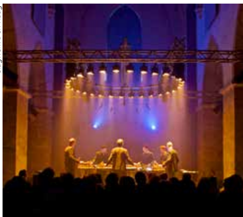
Slagwerk Den Haag