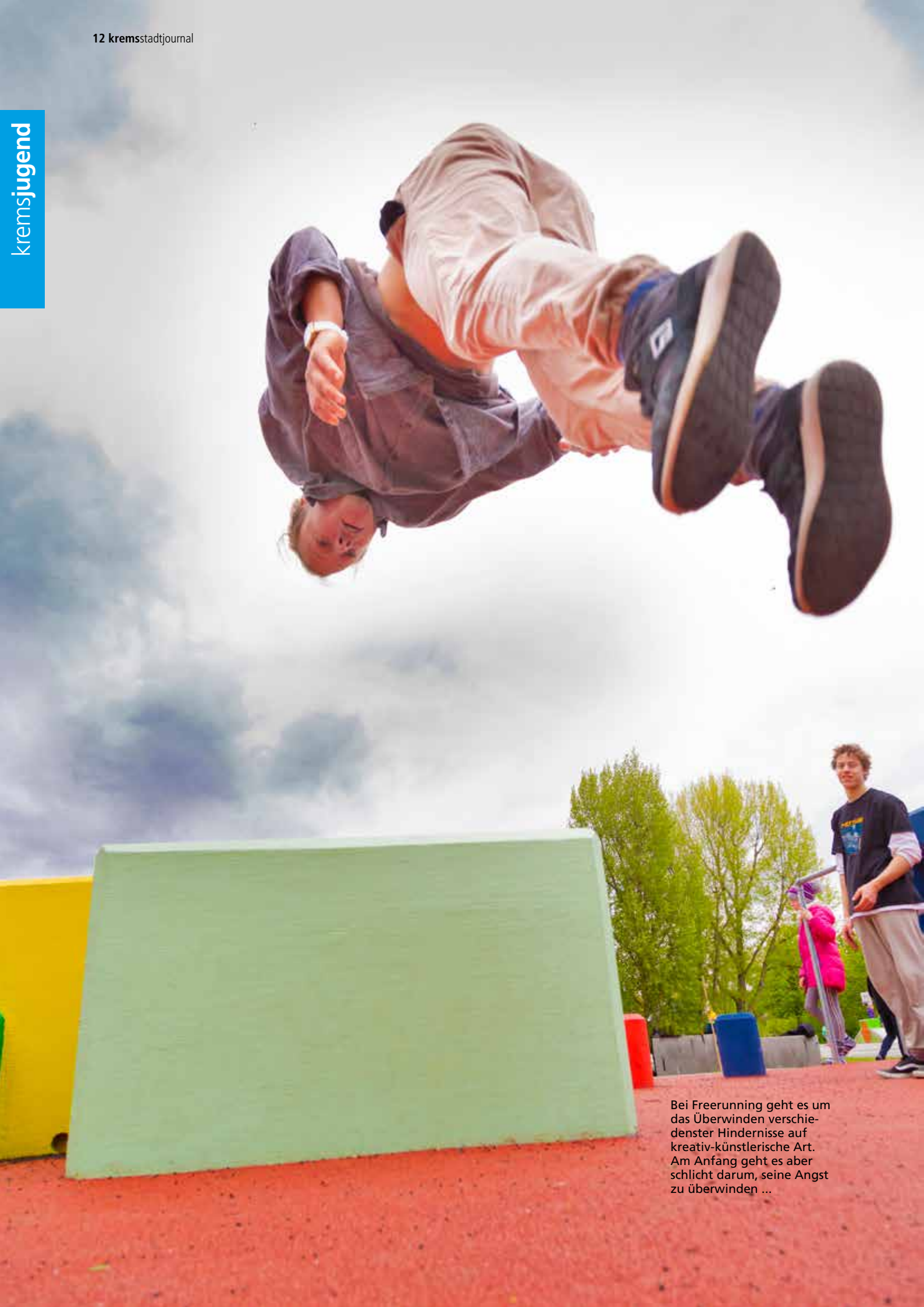
Bei Freerunning geht es um das Überwinden verschiedenster Hindernisse auf kreativ-künstlerische Art. Am Anfang geht es aber schlicht darum, seine Angst zu überwinden ...