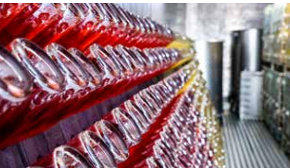
Text und Fotos: Pamela Schmatz